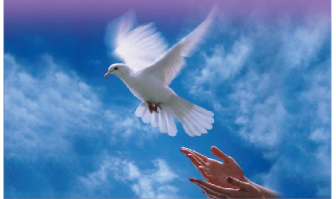
Roll up ( Size = 85W x 200H m )

ศึกษาข้อมูลเพิ่มเติมได้ที่ www.rlpd.moj.go.th หัวข้อ “สิทธิมนุษยชน” / “เปลี่ยนแปลงโทษประหารชีวิตตามหลักสิทธิมนุษยชนสากล”