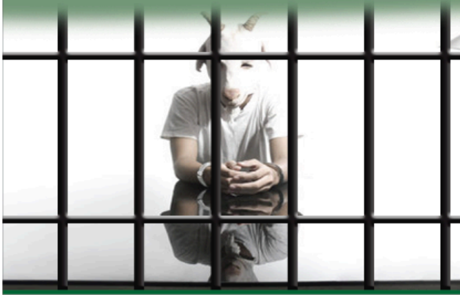
Roll up ( Size = 85W x 200H m )

เป็นคดีดำนาที่จับแพะจำนวน 6 คน ซึ่งแพะดังกล่าวถูกสังคมนับว่าเป็นฆาตกร เนื่องจากศาลชั้นต้นตัดสินประหารชีวิต แต่ศาลอุทธรณ์พิพากษายกฟ้องจำเลยทั้งหมด แต่เนื่องจากโจทก์ได้ฎีกา ดังนั้น ทั้ง 6 คนจึงถูกขังระหว่างรอพิจารณาตัดสินของศาลฎีกาเป็นเวลาถึง 6 ปี จนกระทั่งศาลฎีกามีคำพิพากษาว่า ทั้งหมดเป็นผู้บริสุทธิ์